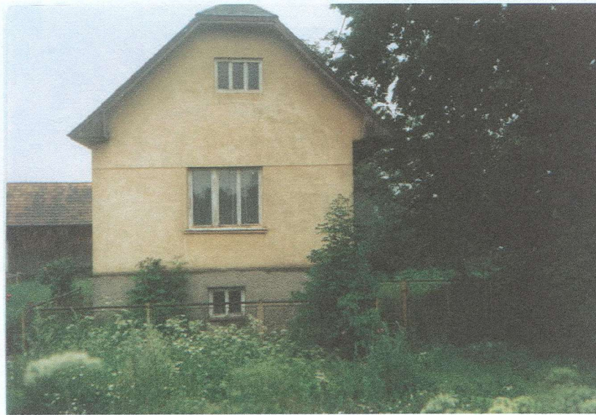
Rodičovský dom v Liesku .