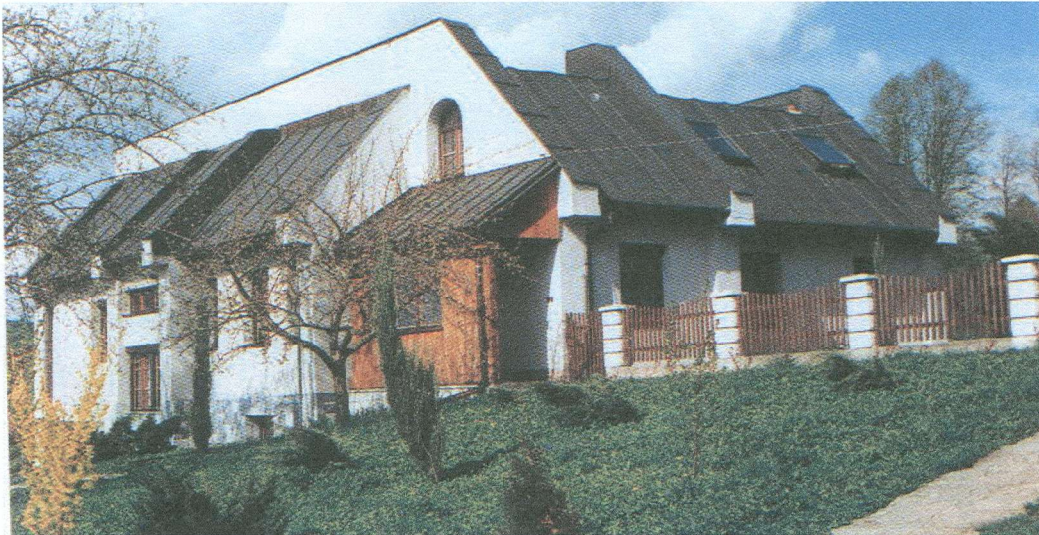
Nová fara v Liptovských Sliačoch .