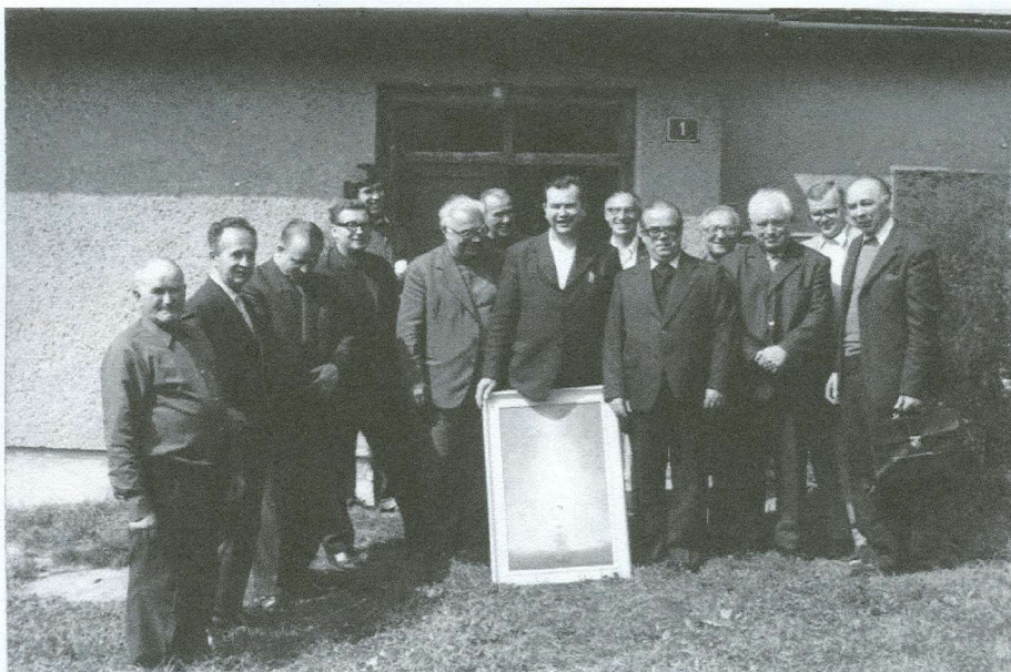
Pred farou v Hrboltovej so spolubratmi.