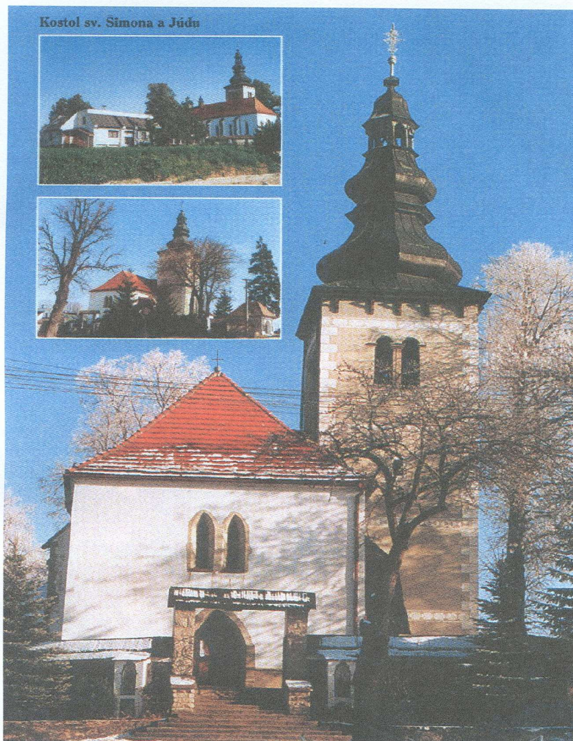
Farský kostol v Liptovských Sliachoch .