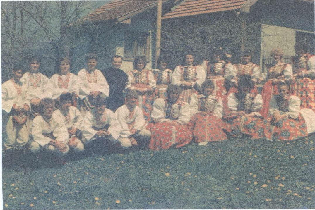
Pred starou farou s májovníkmi .