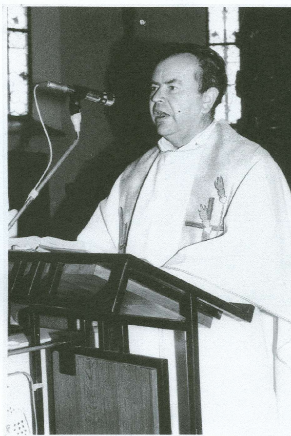
Farár v Liptovských Sliáčoch. Obrázok č.2