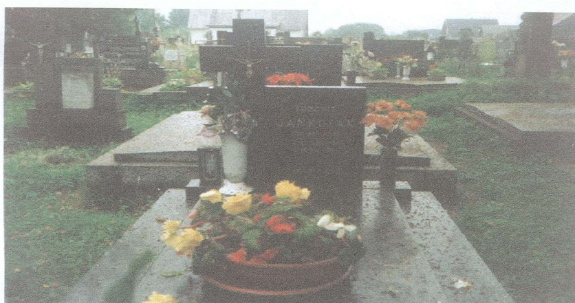
Miesto posledného odpočinku - Liesek. Obrázok č.4.